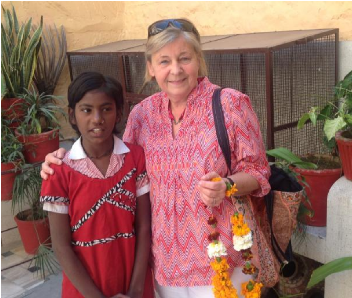
Ein Kind, das ein deutsches Ehepaar auf der Straße fand und nun als Paten fördert