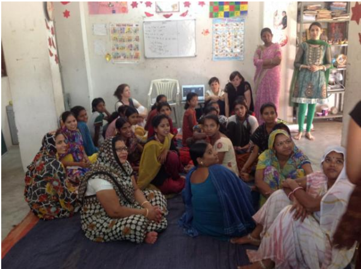
Ein Teil unserer Schülerinnen bei dem Workshop "Bad Touch"