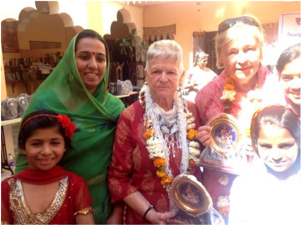
Auch wir wurden für unsere Arbeit geehrt